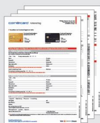
Demande de carte

Important: n'oubliez pas de signer la demande de carte et de joindre les documents requis.